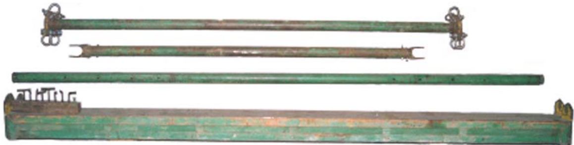
Afstandhouders + caravanbalken Caravanbalken lengte 4 mtr Afstandhouders lengte: 2,5 mtr tot 5 mtr