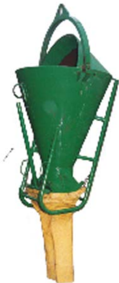
Kubel met stortzak Kubel van 500 ltr tot 1000 ltr Stortzak past aan alle kubels