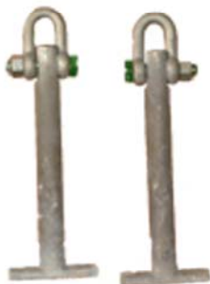
Pasplaathaken t.b.v. kanaalplaatvloeren

Voor kanaalplaatvloeren van 120 cm breedte Evenaar verstelbaar van 1 mtr tot 3,8 mtr lengte Geschikt om binnen platen te leggen Maximaal hefvermogen 5000 kg