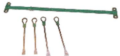
Roosterhaken Voor het leggen van varkens- of rundveeroosters