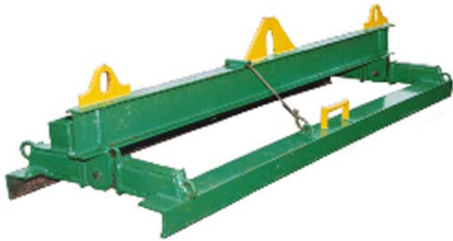
Kanaalplaatvloer klem Echo Voor kanaalplaatvloeren van 60 cm breedte Maximaal hefvermogen 3000 kg