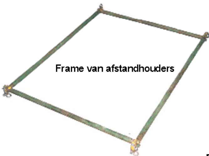
Frame van afstandhouders