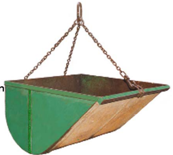
Grondbak Voor zowel grond, zand en puin Inhoud 1 m 3